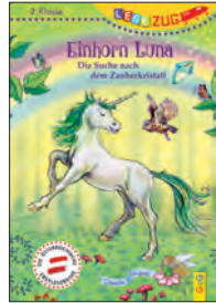
ISBN 978-3-7074-2376-1 2. Klasse, ab 6/7 Jahre