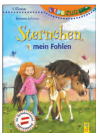
ISBN 978-3-7074-2353-2 1. Klasse, ab 5/6 Jahre