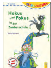
ISBN 978-3-7074-2005-0 2. Klasse, ab 6/7 Jahre