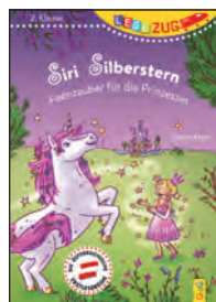
ISBN 978-3-7074-2142-2 2. Klasse, ab 6/7 Jahre