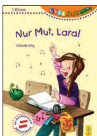
ISBN 978-3-7074-2267-2 1. Klasse, ab 5/6 Jahre