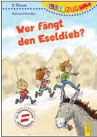
ISBN 978-3-7074-2578-9 2. Klasse, ab 6/7 Jahre