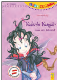
ISBN 978-3-7074-2035-7 2. Klasse, ab 6/7 Jahre