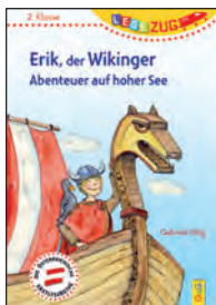
ISBN 978-3-7074-2094-4 2. Klasse, ab 6/7 Jahre