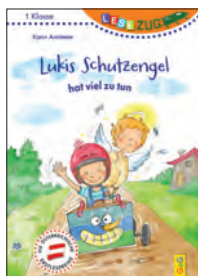
ISBN 978-3-7074-2166-8 1. Klasse, ab 5/6 Jahre