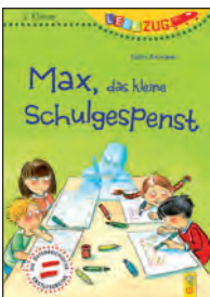
ISBN 978-3-7074-2093-7 2. Klasse, ab 6/7 Jahre