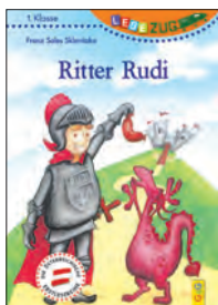
ISBN 978-3-7074-2167-5 1. Klasse, ab 5/6 Jahre