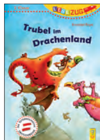
ISBN 978-3-7074-2034-0 2. Klasse, ab 6/7 Jahre