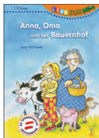
ISBN 978-3-7074-2125-5 1. Klasse, ab 5/6 Jahre