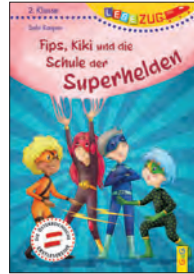
ISBN 978-3-7074-2518-5 2. Klasse, ab 6/7 Jahre