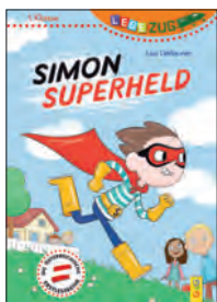
ISBN 978-3-7074-2103-3 1. Klasse, ab 5/6 Jahre