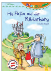
ISBN 978-3-7074-1969-6 1. Klasse, ab 5/6 Jahre