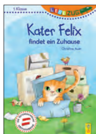
ISBN 978-3-7074-2239-9 1. Klasse, ab 5/6 Jahre