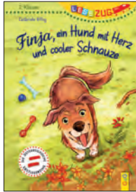
ISBN 978-3-7074-2559-8 2. Klasse, ab 6/7 Jahre