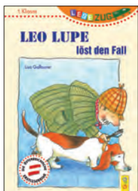
ISBN 978-3-7074-2001-2 1. Klasse, ab 5/6 Jahre