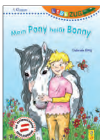
ISBN 978-3-7074-1999-3 1. Klasse, ab 5/6 Jahre