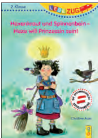
ISBN 978-3-7074-2066-1 2. Klasse, ab 6/7 Jahre