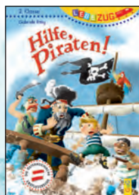
ISBN 978-3-7074-2346-4 2. Klasse, ab 6/7 Jahre