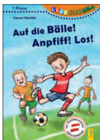
ISBN 978-3-7074-2345-7 1. Klasse, ab 5/6 Jahre