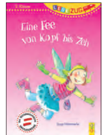
ISBN 978-3-7074-2004-3 2. Klasse, ab 6/7 Jahre