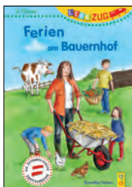
ISBN 978-3-7074-2262-7 2. Klasse, ab 6/7 Jahre