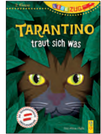
ISBN 978-3-7074-2452-2 2. Klasse, ab 6/7 Jahre