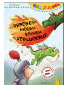
ISBN 978-3-7074-2241-2 2. Klasse, ab 6/7 Jahre