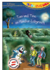
ISBN 978-3-7074-2003-6 2. Klasse, ab 6/7 Jahre