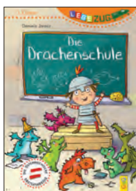
ISBN 978-3-7074-2468-3 1. Klasse, ab 5/6 Jahre