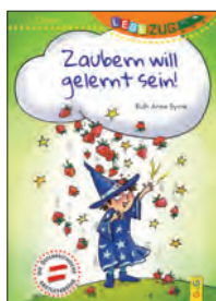
ISBN 978-3-7074-2558-1 1. Klasse, ab 5/6 Jahre