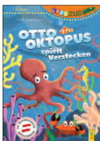
ISBN 978-3-7074-2425-6 1. Klasse, ab 5/6 Jahre