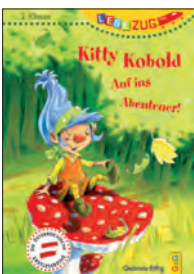
ISBN 978-3-7074-2104-0 2. Klasse, ab 6/7 Jahre