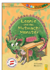
ISBN 978-3-7074-2126-2 1. Klasse, ab 5/6 Jahre