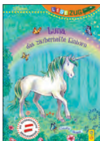
ISBN 978-3-7074-2198-9 1. Klasse, ab 5/6 Jahre