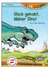
ISBN 978-3-7074-2065-4 1. Klasse, ab 5/6 Jahre