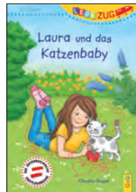
ISBN 978-3-7074-2002-9 2. Klasse, ab 6/7 Jahre