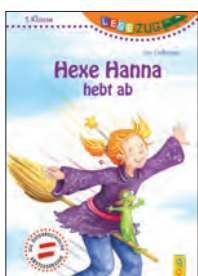
ISBN 978-3-7074-2033-3 1. Klasse, ab 5/6 Jahre