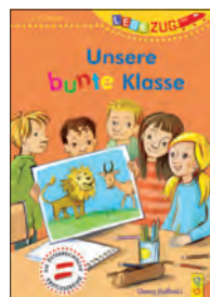
ISBN 978-3-7074-2210-8 2. Klasse, ab 6/7 Jahre